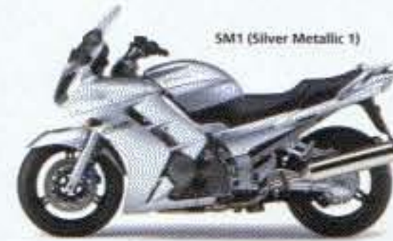
SM1 (Silver Metallic 1)