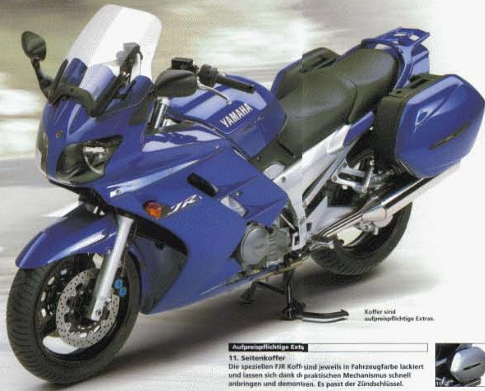
Koffer sind aufpreispflichtige Extras.