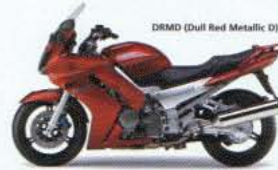
DRMD (Dull Red Metallic D)