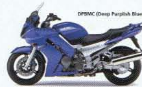
DPBMC (Deep Purplish Blue Metallic C)

Sicher Motorrad fahren. Darum stets mit Helm, Schutzausrüstung und ggfls. mit Schutzhülle fahren. Ziehen Sie partnerschaftliches Verhalten im Straßenverkehr. Änderungen der technischen Spezifikationen und des Ausstattungsprogramms vorbehalten. Weitere Informationen erhalten Sie bei Ihrem autorisierten YAMAHA-Vertragshändler.