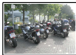
Mac Donalds Remscheid

Die meisten kannten sich, die 3 Ge's --> Gelächter, Gespräche, Gemischtes Eis mit Sahne, aber nur Vanille. Alles wie immer.